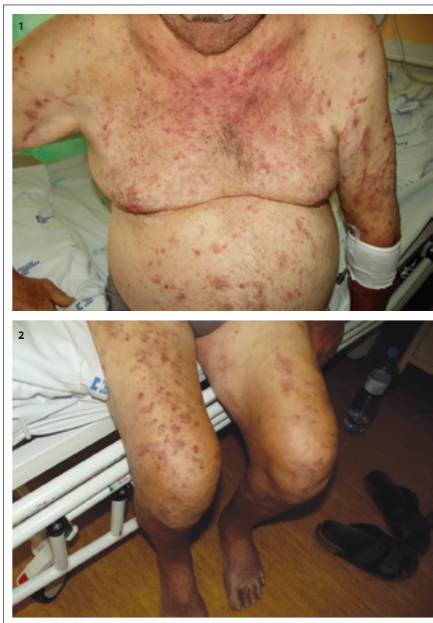
Obr. 1 a 2. Kožní změny při VEXAS syndromu, dermatologická diagnóza byla neutrofilní dermatitida, Sweetův syndrom.

Periferní krev byla odeslána na molekulárně biologické vyšetření do Ústavu