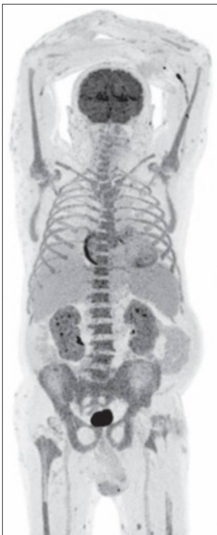
Obr. 4. Ložiska s jasně patologickou akumulací FDG nebyla nalezena, ale abnormálním nálezem je relativně vyšší akumulace FDG v kostní dřeni celého zachyceného skeletu (výpadky v místech TEP kyčlí), ( SUV_{max} do 6,38 v sakrální kosti). Normalizovala se akumulace FDG v horním laloku I. plíce po předchozí alveolitidě. Difúzně hraniční až mírně vyšší akumulace FDG ve slezině ( SUV_{max} 3,82) – v 1/2023 byla pod úroveň akumulace jaterní. Povrchově v kůži a podkoží HKK a DKK více drobných fokálních akumulací FDG ( SUV_{max} do 5,28 dorzálně v polovině levého stehna), méně i v kůži/podkoží hrudníku, břicha, boků, hýždí, a dalších místech.

Abnormalitou je rovněž aktivita ve stěně pravé síně srdeční (mimo standardní metabolicky aktivní stěnu LK srdeční). Další rozložení FDG v rozsahu snímání hlavy, trupu i končetin bez abnormalit. Nejsou známky metabolicky aktivních chrupavek (nos, uši, trachea) – jen jedna drobná fokální akumulace na levém ušním boltci ( SUV_{max} 5,7) – v kůži?